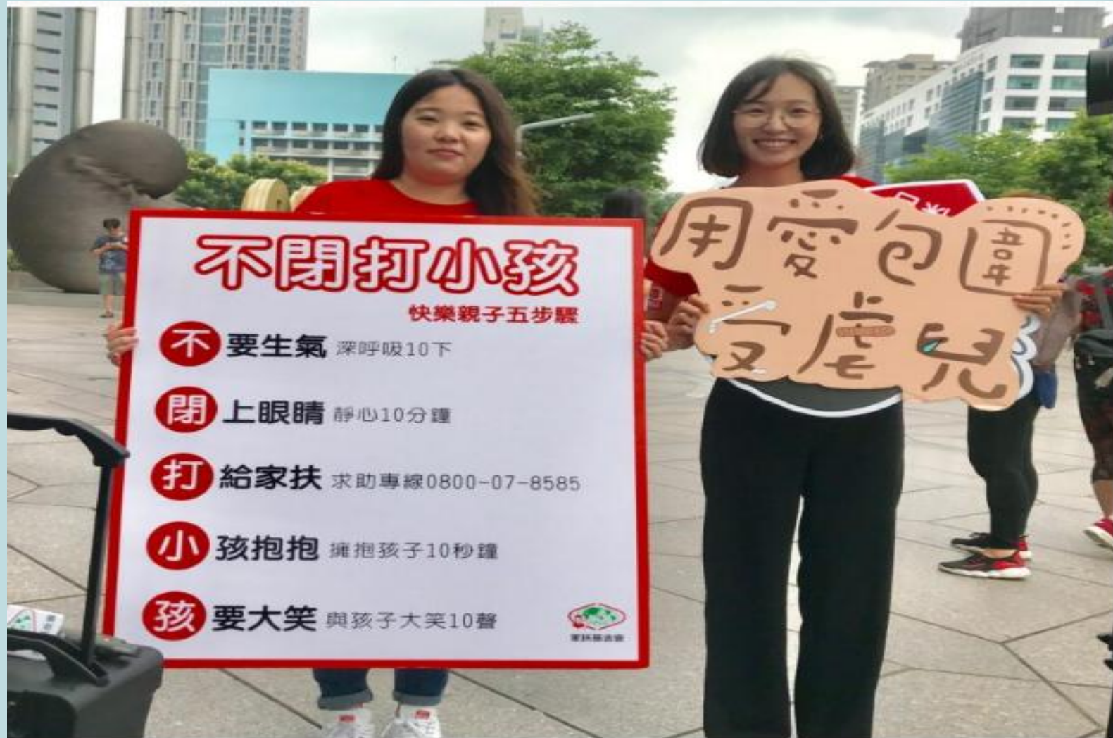
家扶基金會宣導用愛包容的教養方式。