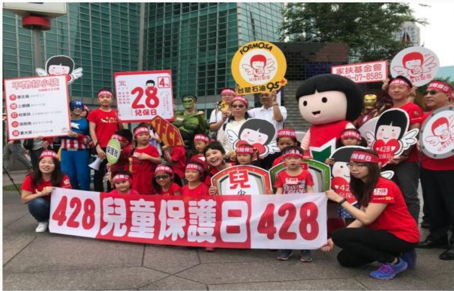
428兒童保護日在101廣場前進行遊行及高喊口號。